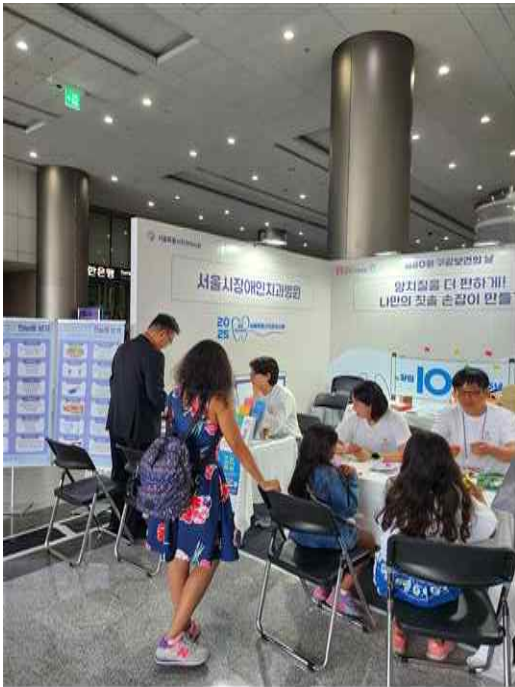
- 행사 참여 모습