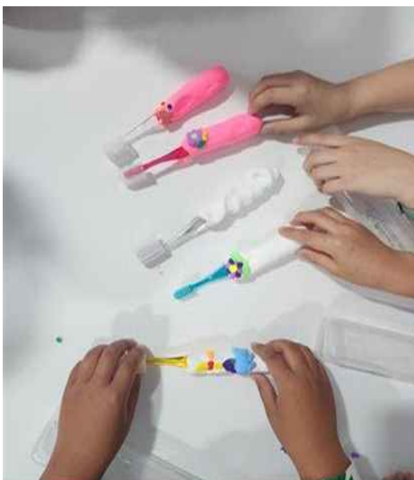
- ‘나만의 칫솔만들기’ 체험 활동 모습