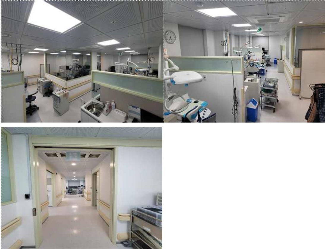
[사진첨부. 서울특별시 장애인치과병원 전신마취진료실]